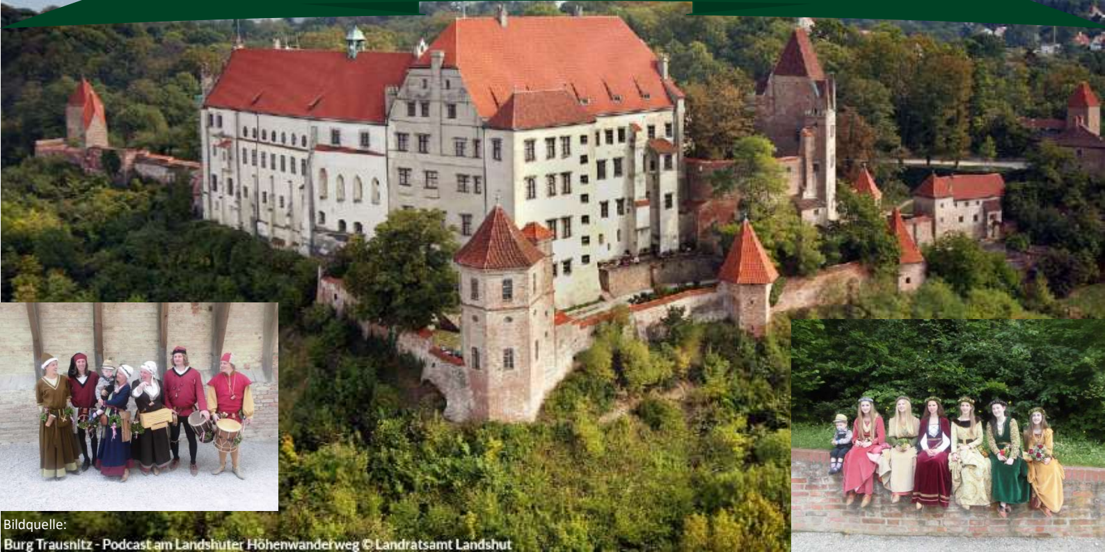
Bildquelle: Burg Trausnitz - Podcast am Landshuter Höhenwanderweg © Landratsamt Landshut